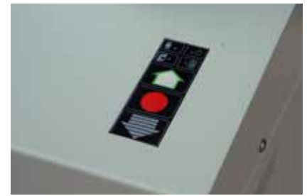
Control electrónico digital