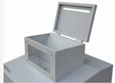
Recolector con tapa abatible